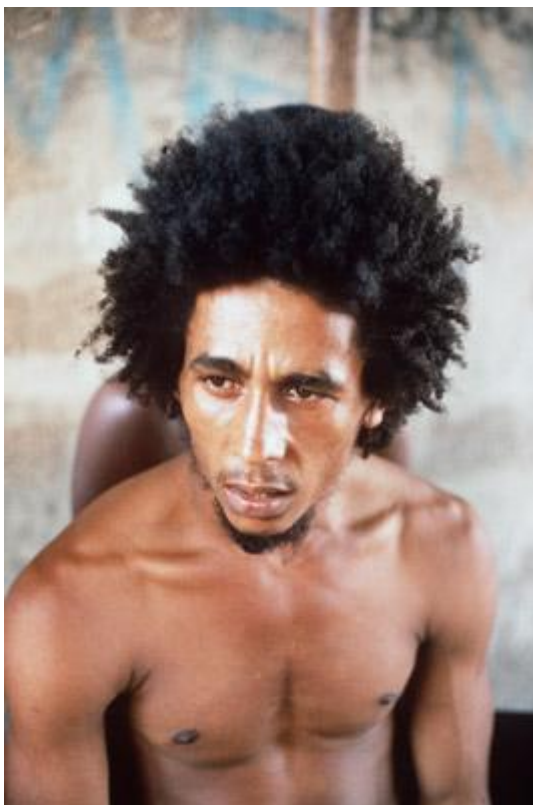
FIGURA 2 BOB MARLEY

estilos musicales jamaicanos, tales como ska, su heredero el rocksteady (creado en 1966) y su sucesor, el reggae.