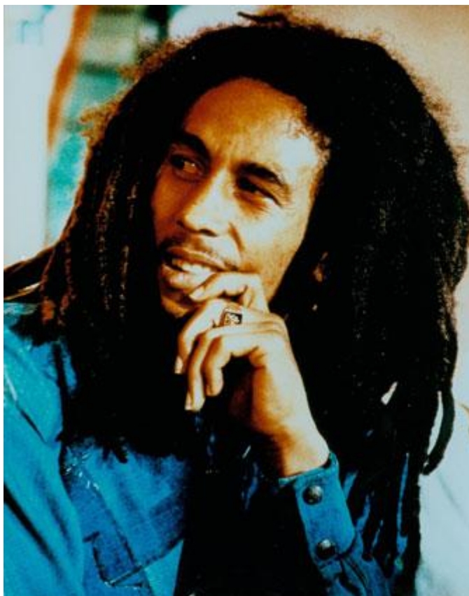
FIGURA 6 BOB MARLEY

Durante la gira grabaron, ya en 1977, un nuevo album Exodus 6 , que se consideró el mejor de los "Wailers" hasta aquel momento, y que convirtió a Bob Marley en una estrella internacional.