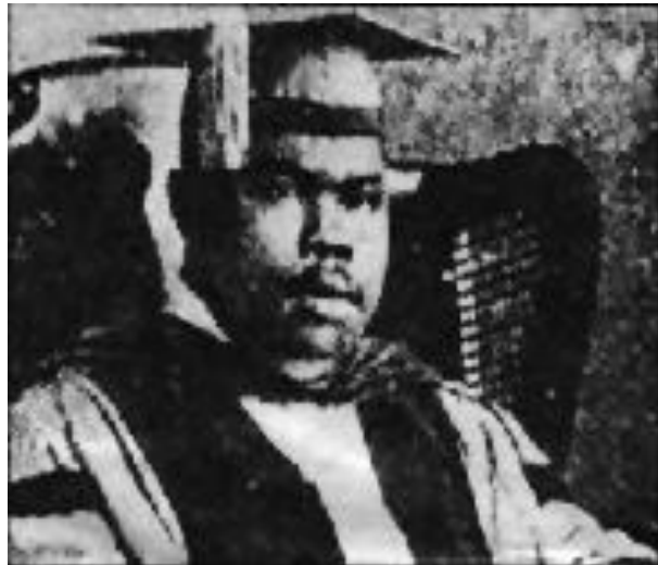
FIGURA 1 MARCUS MOSIAH GARVEY.

La creación del Rastafarismo se debe a una interpretación muy particular de las profecías bíblicas, a las aspiraciones políticas y sociales de los negros y a la visión cultural de un publicista y organizador negro nacido en Jamaica, llamado Marcus Mosiah Garvey (FIGURA 1).