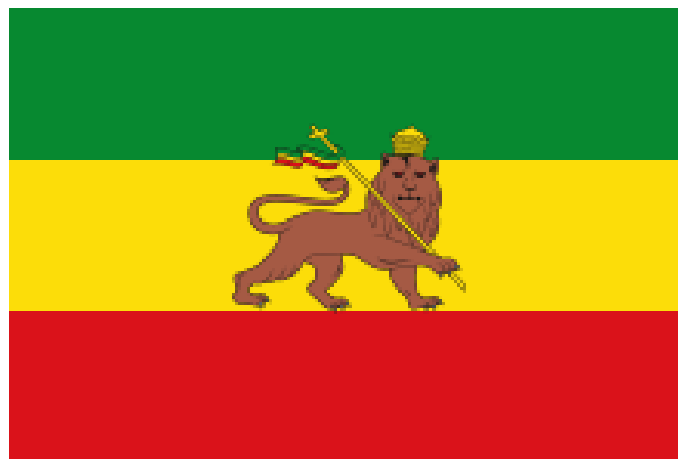
FUGURA 6 BANDERA RASTAFARI

En Estados Unidos se intentó impedir la entrada en las escuelas a los niños con este tipo de peinado así como a trabajadores en ciertos lugares de trabajo, pero los tribunales aceptaron el uso de este tocado.