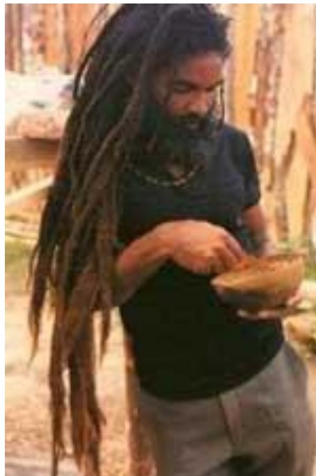
FIGURA 5 DREADLOCKS

Durante la época clásica una minoría de "dreads" utilizaban unas guedejas características, llamadas "dreadlocks (FIGURA 5), que fueron popularizadas por un movimiento monástico opuesto al poder sin límite y corruptor de los Ancianos y del paganismo y lo copiaron de fotografías en que aparecían etíopes o masai. Los dreadlocks se forman en los negros al dejar que el pelo crezca libremente durante largo tiempo; en el caso de los blancos este proceso natural es más lento y desordenado, por lo que los dreadlocks pueden producirse artificialmente dividiendo el pelo en secciones, cardándolo y trenzándolo. Lavan éstos con productos naturales extraídos de plantas silvestres, tales como manzanilla o aloe vera, y los fortalecen y les dan brillo con aceite de coco.